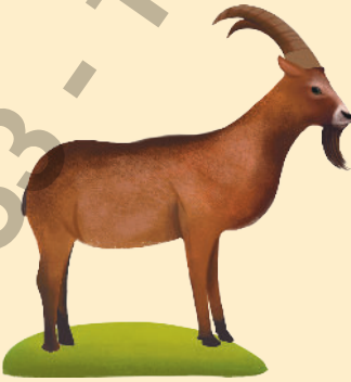
Çengel Boynuzlu Dağ Keçisi