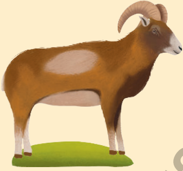
Anadolu Yaban Koyunu